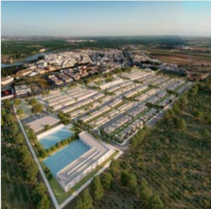
Unas 300 viviendas se construirán desde el Cuartel de la Guardia Civil hasta el Cementerio Municipal

Nuevos inversores apuestan por nuestro municipio. Se construirán casi 400 viviendas en el sector SUB-AR2, SUB-AR3 y se reanudarán las obras de promociones que quedaron paradas en la época de la crisis, ampliando la oferta de la vivienda en nuestro municipio.