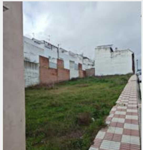
Suelo cedido a la Junta de Andalucía para la construcción de 6 VPO

Inactiva desde hace más de doce años, lo que nos permitirá recuperar suelos municipales y abrir la puerta a futuras convocatorias de subvenciones públicas, algo imposible hasta la fecha.