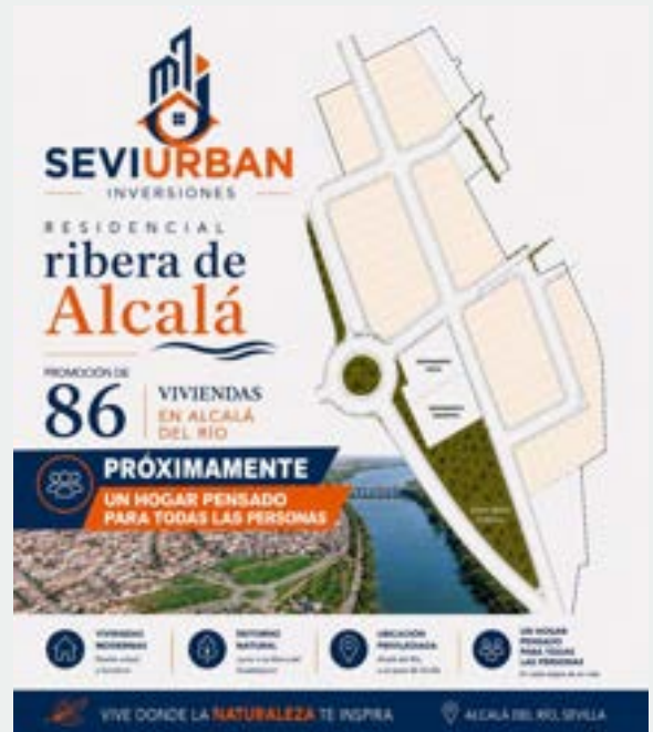
Promoción de 86 viviendas en la zona anexa al Recinto Ferial

Además, desde el Ayuntamiento hemos cedido suelo a la Agencia de Vivienda y Rehabilitación de Andalucía (AVRA) para posibilitar la construcción de Viviendas de Protección Oficial (VPO).