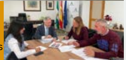
Reunión con el Delegado de Educación de la Junta de Andalucía

En paralelo, seguimos demandando a la Junta de Andalucía la construcción de un nuevo centro o la ejecución de las prometidas obras por valor de 670.000€ .